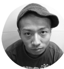
小さい巨人「ラングレー」を 乗りまわす、ハイテンション (本当は)イケメン!